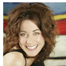
Juliette et ses Roméo

Organisé par le comité Amusement St-Antoine